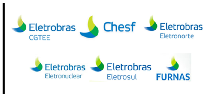
Figura 1 – Empresas Eletrobras G&T

Foram selecionadas as empresas de G&T conforme apresentado nas Figuras 1 e 2.